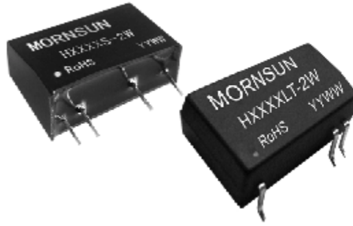
图 3: 金升阳公司的 6000VDC 隔离系列产品